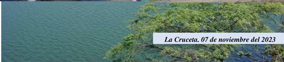
La Cruceta, 07 de noviembre del 2023